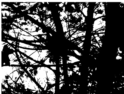
Nest van een lijster in Acer 'Globosum' vlak bij de straat. Deze cultivar is voor vogels als nestgelegenheid zeer geschikt.

Door de grote variatie in bomen, struiken en klimplanten in het gebied is met name geschikt voor de park- en tuinvogels. Gezien de leeftijd en het aandeel doodhout zijn de holenbroeders nog ondervertegenwoordigd. Al deze soorten kunnen broedvogel zijn.