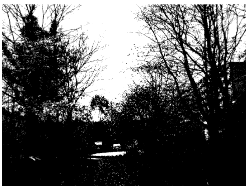
Waardevolle groensingel met grote variatie in structuur en struiken. Biotoop voor vogels, vlinders en kleine zoogdieren als egel