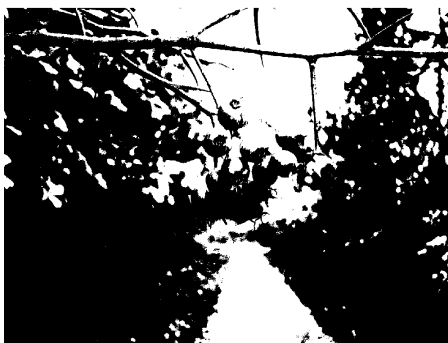
Meidoorn langs het wandelpad kleurrijke en waardevolle besdrager