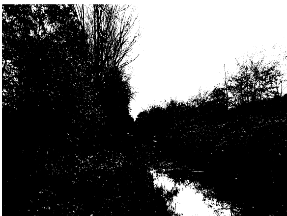
Stedelijke Ecologische Structuur met rechts het spoortalud, de sloot en links in het groen het wandelpad. Door de rust en de variatie in natuurlijke structuren een zeer waardevolle ecologische zone.

Dit gebied kenmerkt zich door een min of meer natuurlijk biotoop met een boom-, struik-, kruid- en waterstructuur. In het oosten van het plangebied ligt het verpleeghuis Blauwbörgje, aan de zuid- en oostkant begrensd door bovengenoemde ecologische structuur. Het terrein van Blauwbörgje zelf kenmerkt zich door substantieel parkachtig groen dat bestaat uit gazons en bomen en struiken. Aan de oostzijde van de sportvelden wordt het wandelpad eveneens door groenstroken begeleid. De volgende biotopen zijn in het hele plangebied aanwezig: