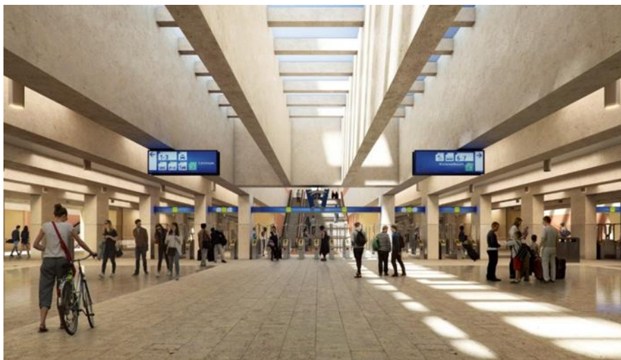
Afbeelding 1: reizigerstunnel