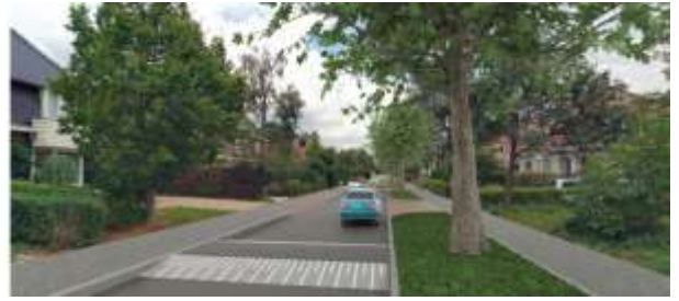
De Meerweg, gezien richting het centrum van Haren, bestaande situatie (links) en een visualisatie van de toekomstige situatie (rechts).