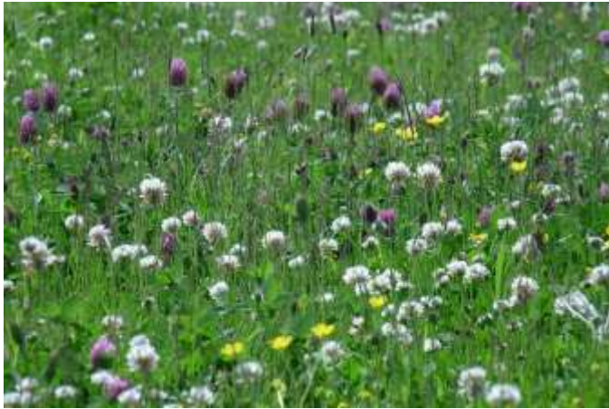
Het bloemenmengsel 'nectar onder het maaimes'.

De groenvakken zullen met bloembollen en het mengsel 'Nectar onder het maaimes' worden ingezaaid. Dat is een bloemenmengsel dat meegezaaid kan worden met een kleine hoeveelheid gazongrasmengsel. De soorten in het mengsel kunnen in het lage gazon vaak toch bloemen vormen die benut kunnen worden door bestuivende insecten. Dit mengsel is vooral op insecten gericht, ter ondersteuning van ecologisch beheer.