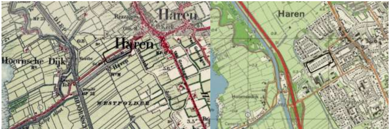
De Meerweg rond 1925 (links) en begin jaren 1990 (rechts).

Aan het begin van de 20 e eeuw liet Jan Evert Scholten een onverharde weg van Haren richting Paterswolde aanleggen, ter plaatse van de huidige Meerweg. Dit werd de uitvalsweg van Haren richting Eelde – Paterswolde. Na de aanleg van de A28 begin jaren 1970 werd de Meerweg binnen de bebouwde kom een doodlopende weg en veranderde de functie van dit deel. De Emmalaan, en later de Vondellaan, werden belangrijker in het verkeersnetwerk van Haren. Sindsdien is de Meerweg in de bebouwde kom van Haren een woonstraat.