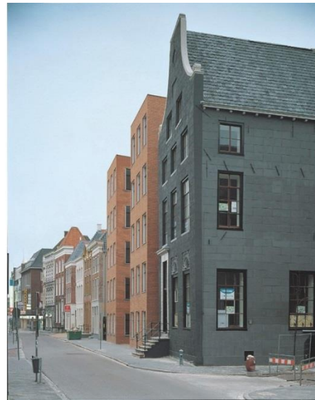
Afbeelding: impressie huidige situatie en toekomstige situatie.