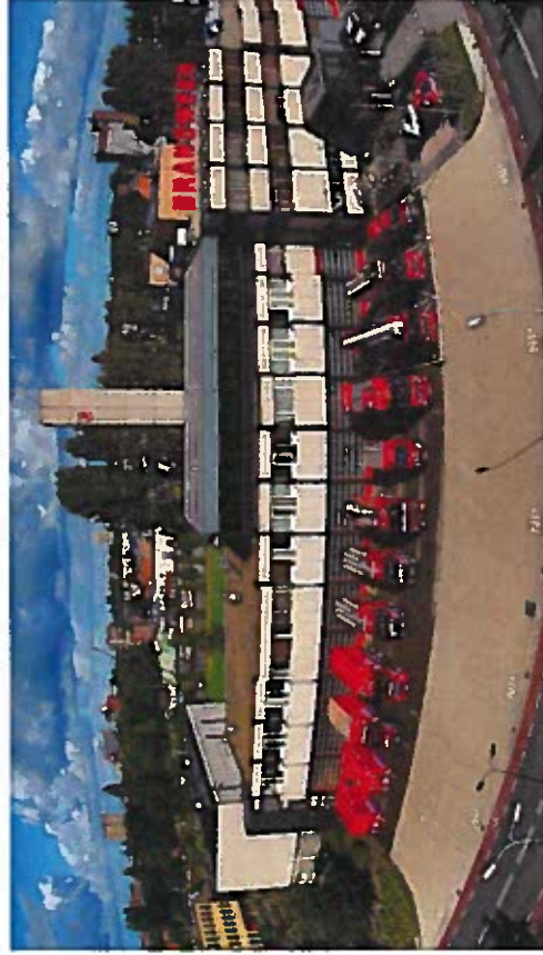
Kazerne aan de Sontweg