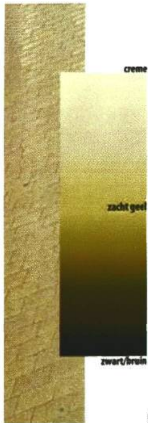
Kleurstelling voor terrasmeubilair binnenstad

Al het meubilair in de binnenstad moet passen binnen de voorgeschreven kleurstelling. De keuze hiervoor is gebaseerd op stedenbouwkundig beeld van de stad met haar gele steen. Verder is gekozen voor de natuurlijke kleuren van hout en rotan. De kleurschakering loopt van crème-wit naar zacht geel, naar donkergrijs, donkerbruin en zwart. Binnen deze kleurstelling zoekt de horecaondernemer de stijl die bij zijn onderneming past.