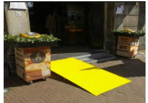
Dat winkels minder toegankelijk zijn kan te maken hebben met historische panden en inrichting. Voor een deel is dat een onontkoombaar feit, maar er is ruimte voor verbetering van de toegankelijkheid. Kleine aanpassingen en creatief denken kan een wereld van verschil maken.