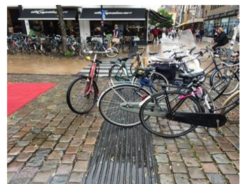
In het straatbeeld is te zien dat veelvuldig fietsen zodanig worden geparkeerd dat ze een obstakel zijn. Een flyer met daarop de oproep de fiets in de vakken te zetten zou kunnen helpen.