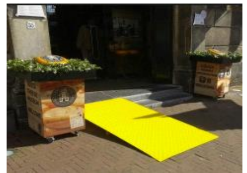
Wat winkels minder toegankelijk zijn kan te maken hebben met historische panden en inrichting. Voor een deel is dat een onontkoombaar feit, maar er is ruimte voor verbetering van de toegankelijkheid. Kleine aanpassingen en creatief denken kan een wereld van verschil maken.