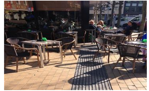
Er wordt niet altijd stil gestaan bij toegankelijkheid. Kijk naar de terrassen. Stoeltjes en tafeltjes staan nog aardig als het terras leeg is- maar gaan er mensen zitten worden de doorgangen steeds krappere.