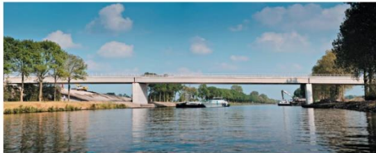
Voorbeeld van een brug zonder bovenbouw: Hogewegbrug Zuidhorn (in N355)