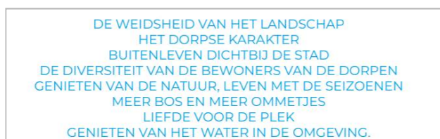
Fig. 1: Kwaliteiten die de MEER-dorpers het meest waarderen (methodiek Typisch Gronings).

De Belangenvereniging heeft een eerste aanzet gemaakt voor het ontwikkelen van een nieuwe dorpsvisie aan de hand van de methodiek ‘Typisch Gronings’, zie figuur 1 en bijlage 2. Het is opvallend hoe natuur, het dorpse karakter, groen en de weidsheid van het landschap wordt gewaardeerd door onze bewoners. Ook de resultaten van ons MEER-denkpanel (middels enquêtes vragen we de mening van MEER-dorpers over diverse onderwerpen) ondersteunen dit: ruimte, weidsheid, vergezichten, rust, weilanden, veel groen, kleinschaligheid en het dorpse karakter worden het meest gewaardeerd (zie bijlage 3).