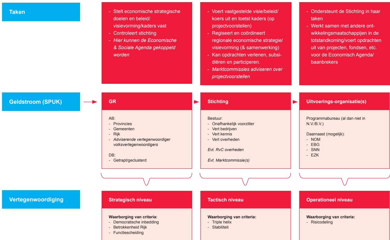
Figuur 1 Variant Triple Helix