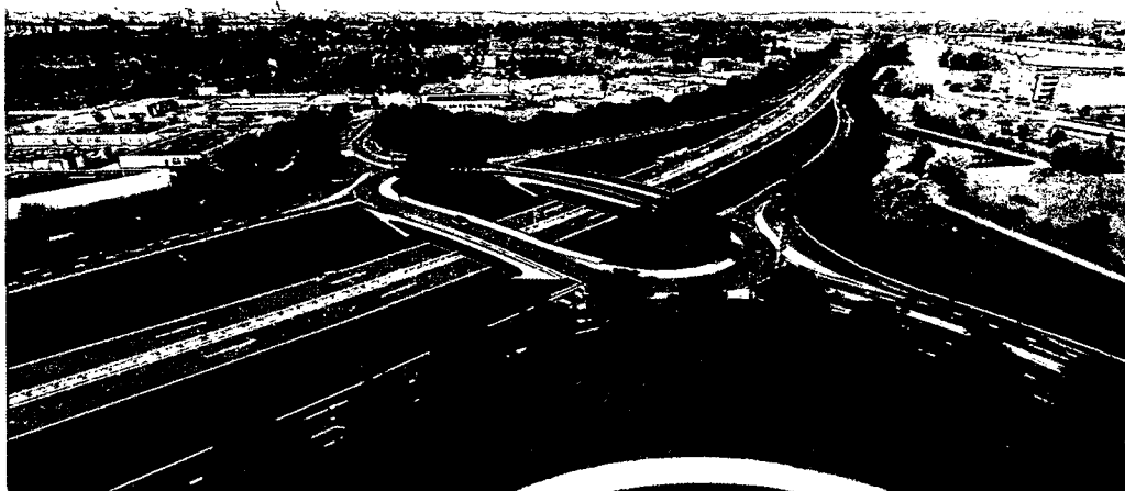
Nieuwe inrichting kruising Lewenborg Ulgersmaborg.