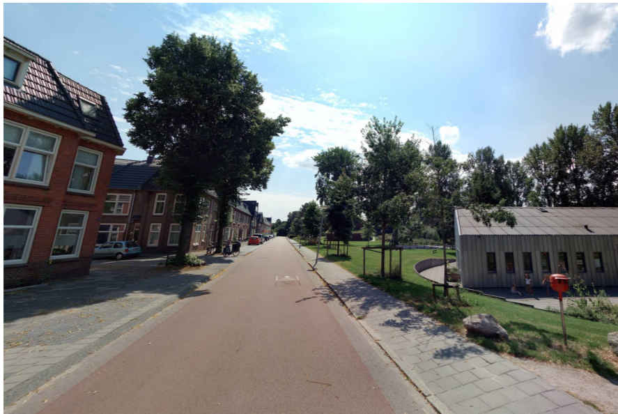
Voorbeeld fietsstraat eenrichtingsverkeer