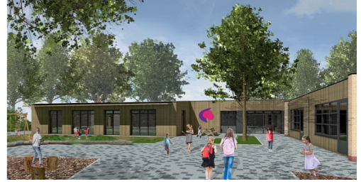
Verbouw Peter Petersenschool