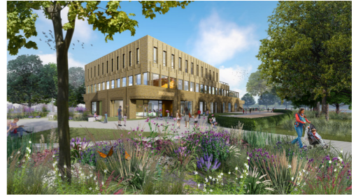
Nieuwbouw IKC Rummerinkhof