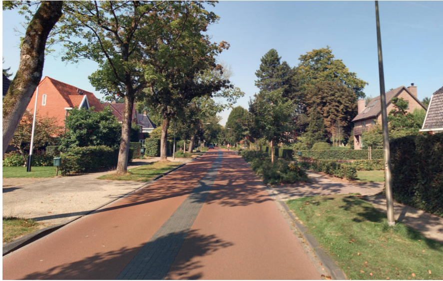
Voorbeeld fietsstraat tweerichtingsverkeer