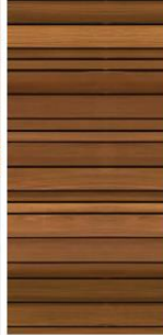
Ayous houten gevelbekleding