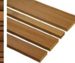
barcode profiel 18x45/70/90/140