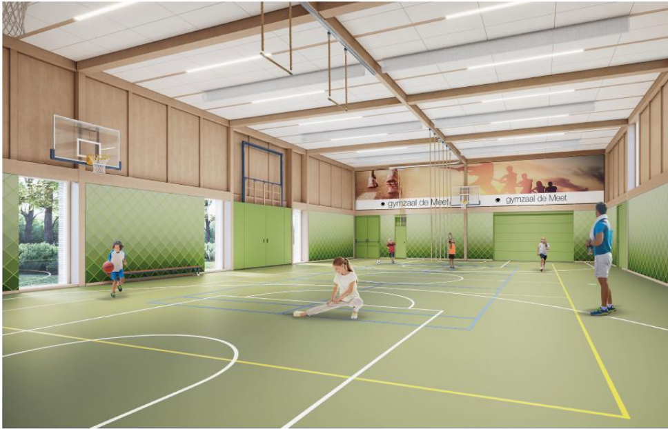
nieuwbouw gymzaal de Meet