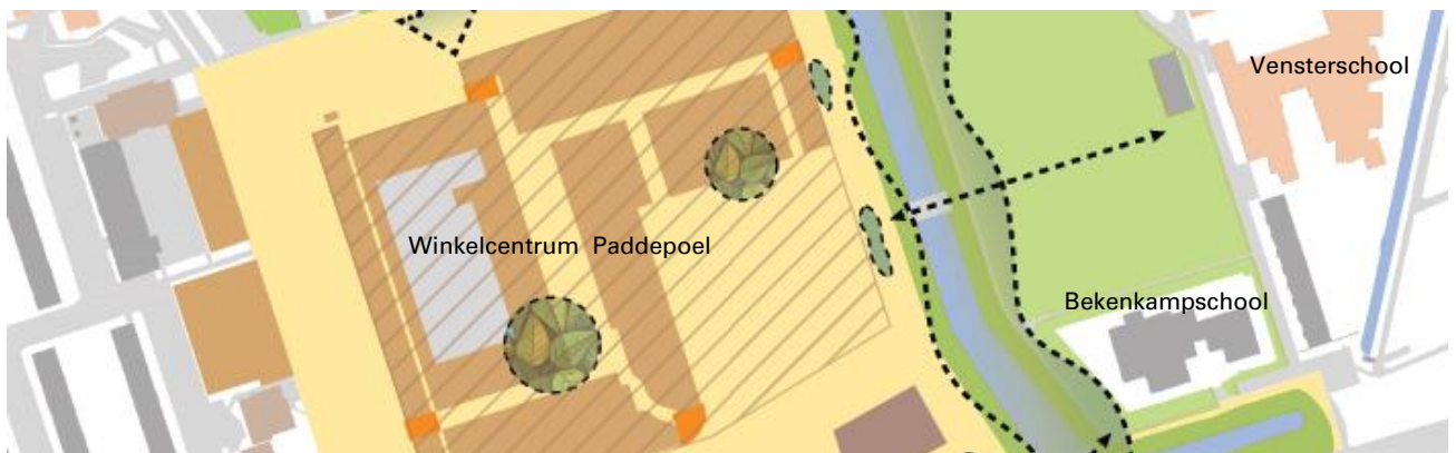
Afbeelding: oorspronkelijke locatie brug Dierenriemstraat uit Masterplan

Door het aanleggen van de brug vanaf de Bekenkampschool naar het winkelcentrum Paddepoel (Dierenriemstraat) kan ook een parkeerprobleem bij de Bekenkampschool worden opgelost. De verkeersopstopping op de Wilgenlaan ontstaat met name aan het begin en eind van de schooldag door parkerende ophalers en wegbrengers. Parkeren voor ophalers en wegbrengers van de kinderen van de school mag nu op de parkeerplaats van het winkelcentrum. De kinderen kunnen dan via de nieuwe brug de school bereiken. De CVvE Winkelcentrum Paddepoel heeft ingestemd met het gebruik van de parkeerplaats. In het Masterplan stond deze brug iets noordelijker ingetekend, maar op verzoek van bewoners en door het voordeel van de parkeeroplossing bij de school is deze op een andere plek gesitueerd. (zie ook bijlage 1 Schetsontwerp parkbrug)