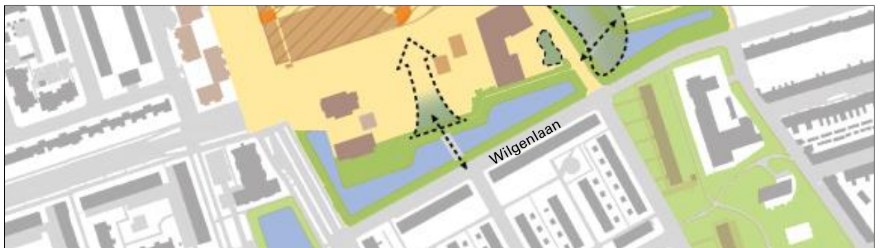
Afbeelding: verbinding van Wilgenlaan naar winkelcentrum Paddepoel

De bruggen zijn in nauw overleg met de bewoners, ondernemers en andere betrokkenen uitgewerkt. Wij stellen voor om beide bruggen in Paddepoel aan te leggen en vragen uw raad de voorgestelde financiering vast te stellen.