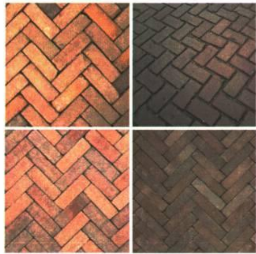
klinkers dikformaat genuanceerd parkeren hergebruik dikformaat