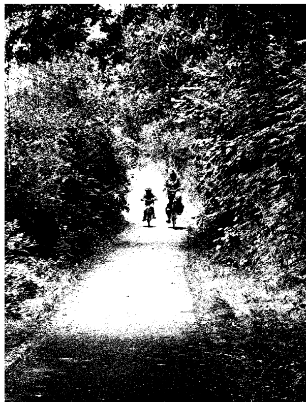
huidige situatie fietspad

Op kaart 1, welke als bijlage is toegevoegd, is te zien waar het werk van Rijkswaterstaat ophoudt (dunne rode lijnen) en waar het voorgestelde werk van de gemeente begint (ingekleurde roze en groene vlakken).