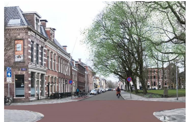
Visualisatie: betere ruimteverdeling en herstel kruisingen

In het ontwerp wordt ruimte gemaakt voor meer groen. In totaal worden 16 nieuwe bomen geplant en wordt samen met bewoners nagedacht over het beplanten en beheren van de boomspiegels.