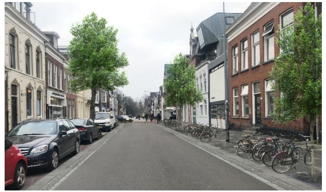
Visualisatie herinrichting: duidelijke plekken voor fietsparkeren