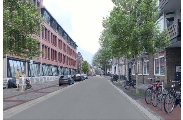
Visualisatie herinrichting: meer bomen en versmalling rijbaan

In het ontwerp zijn voldoende en duidelijke plekken aangewezen voor het parkeren van fietsen, waarbij rekening wordt gehouden met de behoefte per locatie. Aan de oostzijde waar het trottoir relatief smal is, worden enkele fietsklemmen geplaatst met daartussen een vak om fietsen te parkeren zonder klem. Uit studie door studenten van Windesheim, dat in deze buurt is uitgevoerd, blijkt dat vakken voor fietsen een goede manier is om de ruimte daarbuiten vrij te houden. Om een licht en flexibel straatbeeld te creëren worden fietsvakken aangelegd en om de 5 m voorzien van een fietsnietje om omvallen te voorkomen. Nadere uitwerking moet uitwijzen of meer fietsnietjes of beugels nodig zijn. Aan de westzijde kunnen straks op een aantal plekken fietsen worden geparkeerd waar nu auto's staan. Op verzoek van bewoners wordt ernaar gestreefd om het aantal parkeerplekken voor auto's in de straat niet te laten afnemen. Dit wordt bereikt door een betere verdeling van de ruimte met een duidelijke zonering.