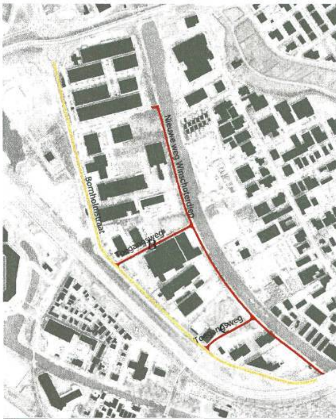
Afbeelding 3. Wegenstructuur

Op de nieuwe verkeersontsluiting in het project Bornholmstraat-zuid wordt een parkeerverbod aanbevolen. Dit betreft alle wegen binnen de gehele verkeersstructuur tussen Bornholmstraat, Winschoterdiep en Bergenweg. Parkeren op de wegen binnen het bedrijventerrein wordt als onwenselijk beschouwd. Bij de nieuwe ontsluiting langs het Winschoterdiep en daarmee nieuwe (her)inrichting van de diverse kavels langs deze route, worden de bedrijven verzocht parkeren op eigen terrein te organiseren. Het parkeerverbod is in lijn met de overige bedrijventerreinen binnen het Winschoterdiepgebied.