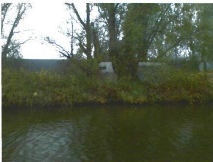
Afbeelding 4. huidig beeld winschoterdiep