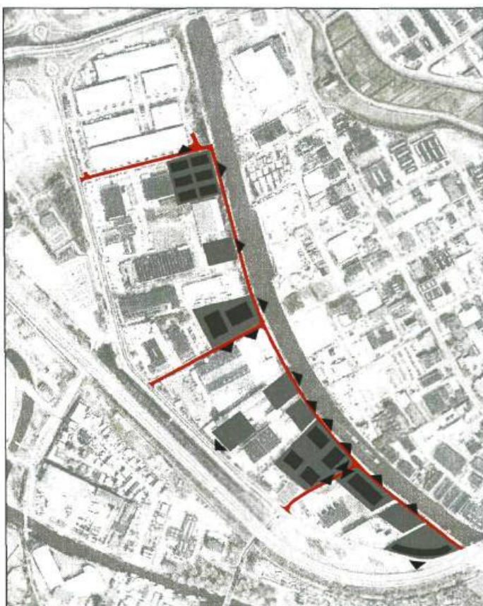
Afbeelding 2. Nieuwe ontsluiting en mogelijke nieuwe economische ontwikkelingen

Met deze nieuwe impuls krijgt het gebied een nieuwe uitstraling met het accent op het verbeteren van de bereikbaarheid, verduurzaming en functionaliteit van het gehele projectgebied. Het nieuwe ontwerp biedt kansen voor nieuwe economische ontwikkelingen.