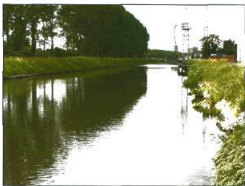
Afbeelding 5. Referentie van bomen langs kanaal

Op 7 februari 2012 heeft het college, agendapunt 3o, een kapvergunning verleend en bent u middels een brief hierover ingelicht.