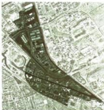
B&W-besluit d.d.: 21 april 2015

Op 26 september 2012, rb. nr. 8b is de laatste herziene grondexploitatie Revitalisering Zuid-oost vastgesteld. Deze grondexploitatie was gebaseerd op de boekwaarde per 1 juli 2012. Wij vragen de raad de herziene grondexploitatie Revitalisering Zuid-oost, gebaseerd op de boekwaarde per 10-12-2014, vast te stellen, inclusief een kredietaanvraag voor € 179.000 uitvoeringsbudget voor de verlenging van de Uppsalaweg achter het groothandelscentrum. Voor dit aanvullend uitvoeringskrediet van 179.000 euro zijn geen extra gemeentelijke middelen noodzakelijk. Het krediet wordt gedekt uit de beschikbare middelen binnen deze geactualiseerde GREX. Een specificatie van de dekkingsbronnen is opgenomen in de toelichting bij de herziene exploitatiebegroting Revitalisering bedrijventerreinen Winschoterdiep en Eemskanaal zuidoost 2015 welke onder de geheimhoudingsplicht valt.