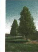
Pyrus calleryana charitaeer