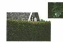
Hedge: Acer Campestre (spanse Aak) hoogte 1,20 meter.