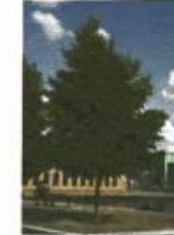
Ailurus v. spathulifolia

Bomen in drie soorten gemengd te gebruiken. Hoogte ongeveer 15 a 20 meter.