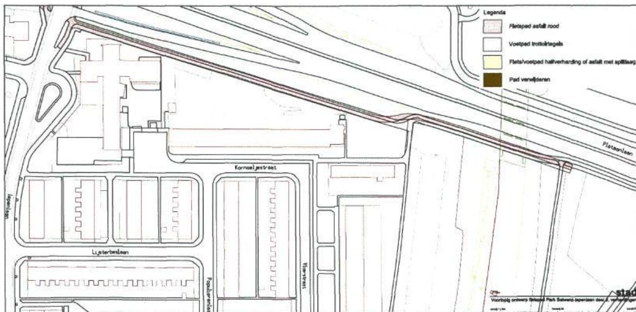
Afbeelding 3: ontwerp fietspad traject Cortingborg - Iepenlaan

Omdat het toekomstige fietspad langs Cortingborg straks één geheel vormt met het tegelfietspad, wordt het asfalteren van het tegelfietspad naar voren gehaald. Het sluit dan ook aan op het toekomstige fietspad langs de Noordelijke Ringweg. Het ontwerp- en de voorbereidingskosten zijn voorgefinancierd uit de plankosten van het fietspad langs de Noordelijke Ringweg en zijn daarom in deze kredietaanvraag meegenomen.