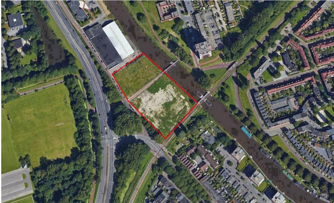
Ligging plangebied en impressie bouwplan, hoek Westelijke Ringweg/Friesestraatweg/Reitdiep

Voor de voormalige ACM-locatie aan de Friesestraatweg is een grootschalig woningbouwplan ontwikkeld, waarvoor een aanvraag omgevingsvergunning is ingediend die voorziet in 292 woningen.