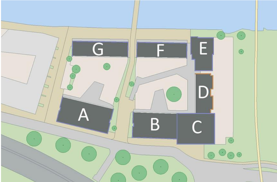
Bouwblokstructuur plan Crossroads, met in de zuidwesthoek de woontoren (blok C)

Het plan omvat een divers en hoogwaardig woonprogramma dat bestaat uit 292 woningen. Het betreft 273 appartementen, variërend van volwaardige startersappartementen met een huurprijs die valt binnen de sociale huursector tot ruime appartementen in de vrije sector. Naast appartementen voorziet het plan in 19 gezinswoningen langs de kade van het Reitdiep.