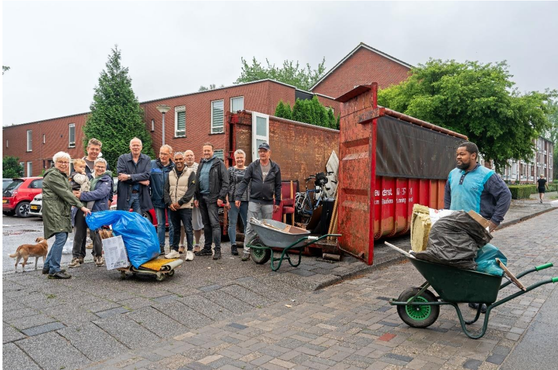
De succesvolle opruimactie in Selwerd-Oost