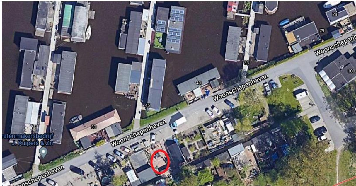
Figuur 2 Ter plekke van de rode cirkel is de projectlocatie globaal weergegeven