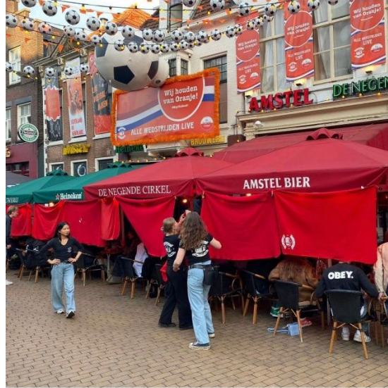
Scherm vanaf de Nieuwe Markt Terras Poelestraat na bezoek Handhavers