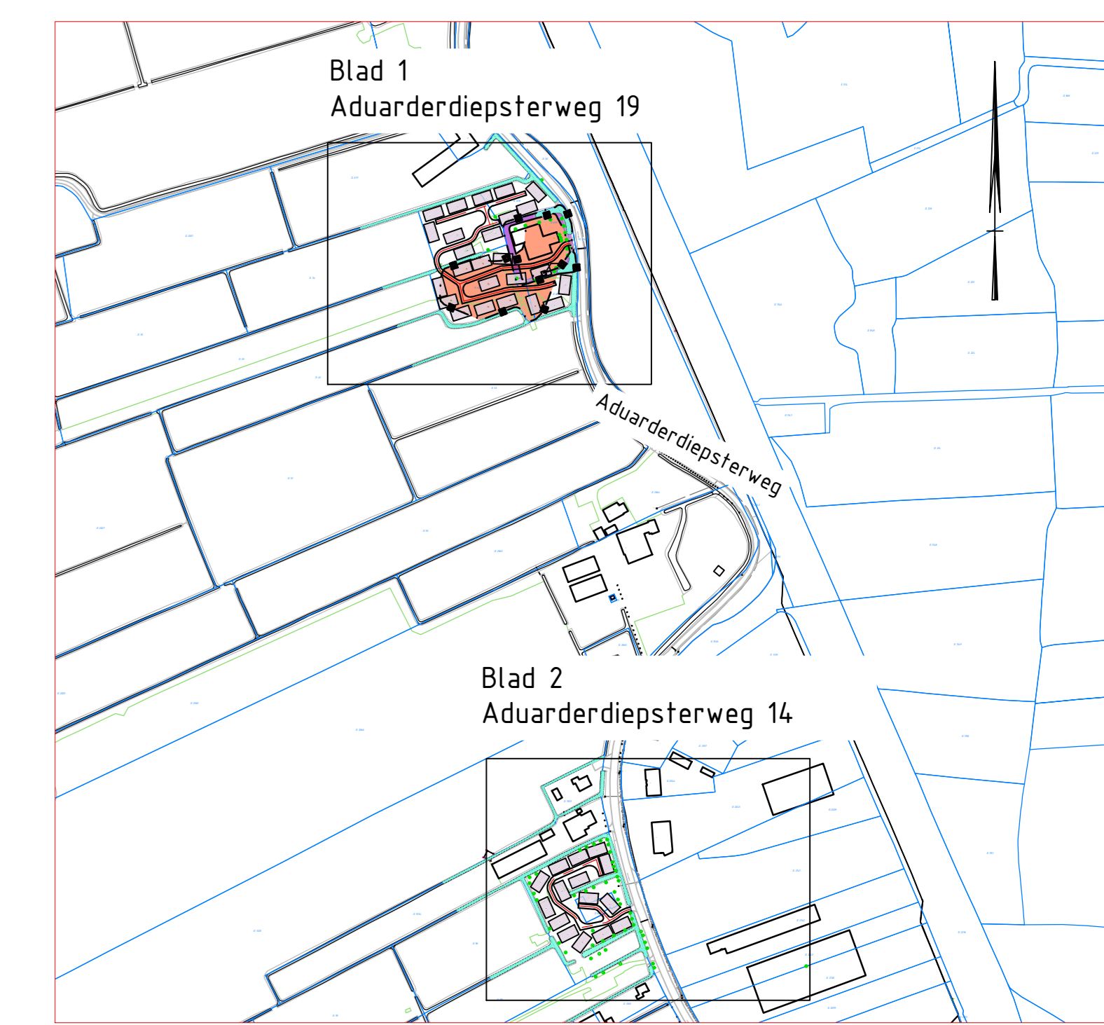
Overzichtstekening schaal 1:5000