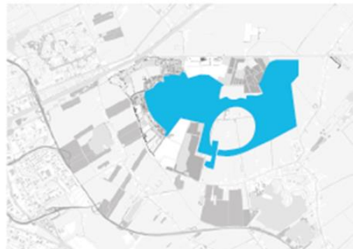
Links: de kaart van het Masterplan Meerstad 2005