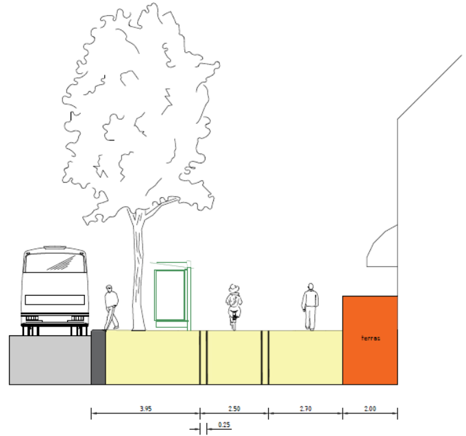
Afbeelding 6: nieuwe profiel zuidzijde Gedempte Zuiderdiep