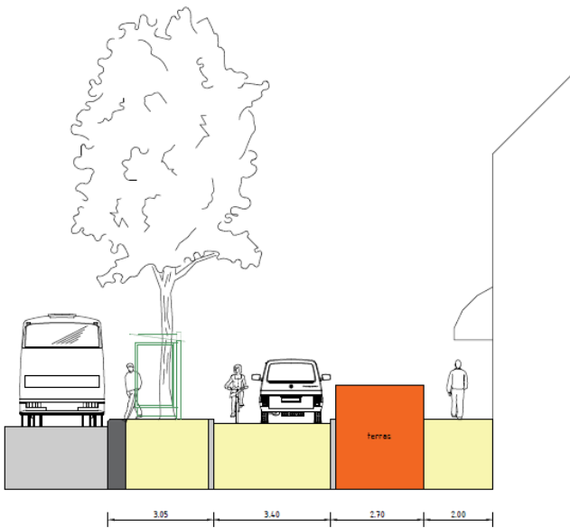
Afbeelding 5: huidige profiel zuidzijde Gedempte Zuiderdiep