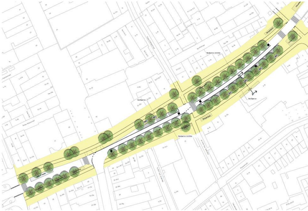
Afbeelding 4: Nieuwe situatie haltering Gedempte Zuiderdiep