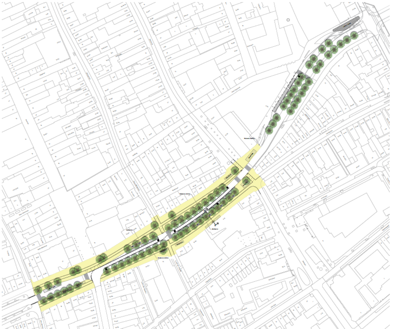
Afbeelding 3: totaaloverzicht uitbreiding haltering Gedempte Zuiderdiep en Gedempte Kattendiep

Hierna zijn een aantal verbeelding en dwarsdoorsnedes opgenomen van de voorgestelde nieuwe situatie. Het gaat om een functioneel ontwerp, waarbij alle functies zijn opgenomen, maar waarbij de exacte locatie nog meer precies moet worden bepaald. Dit ontwerp zullen we de komende weken verder verfijnen en aanpassen, mede naar aanleiding van het participatieproces.