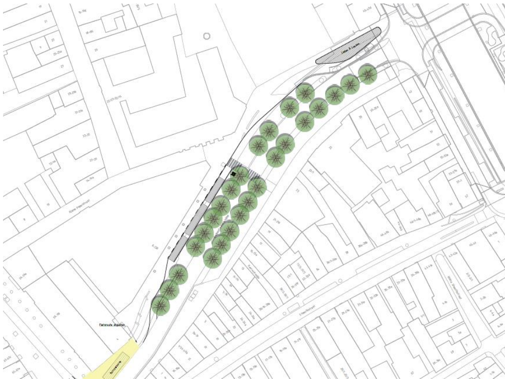
Afbeelding 7: nieuwe situatie haltering Gedempte Kattendiep