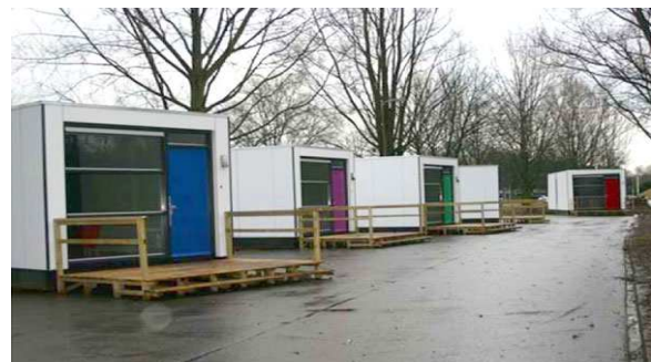
Figuur 1 Voorbeelden van Skaeve Huse

In de gemeente Groningen komen ongeveer 100 personen in aanmerking voor deze bijzondere woonvorm. Het zijn zeer kwetsbare inwoners die zorg nodig hebben. Het gaat hierbij om mensen die in beeld zijn bij de zorgaanbieders en die snel overprikkeld raken 1 .