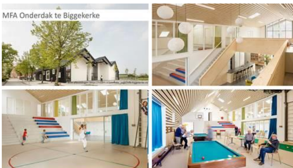
Figuur 1, inspiratie voor de nieuwbouw