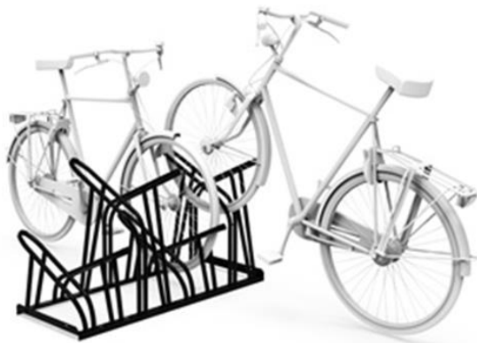
Voorbeeld matzwarte rekken