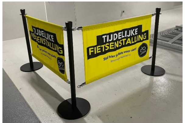
Voorbeeld banner in huisstijl Groningen Fietsstad 050