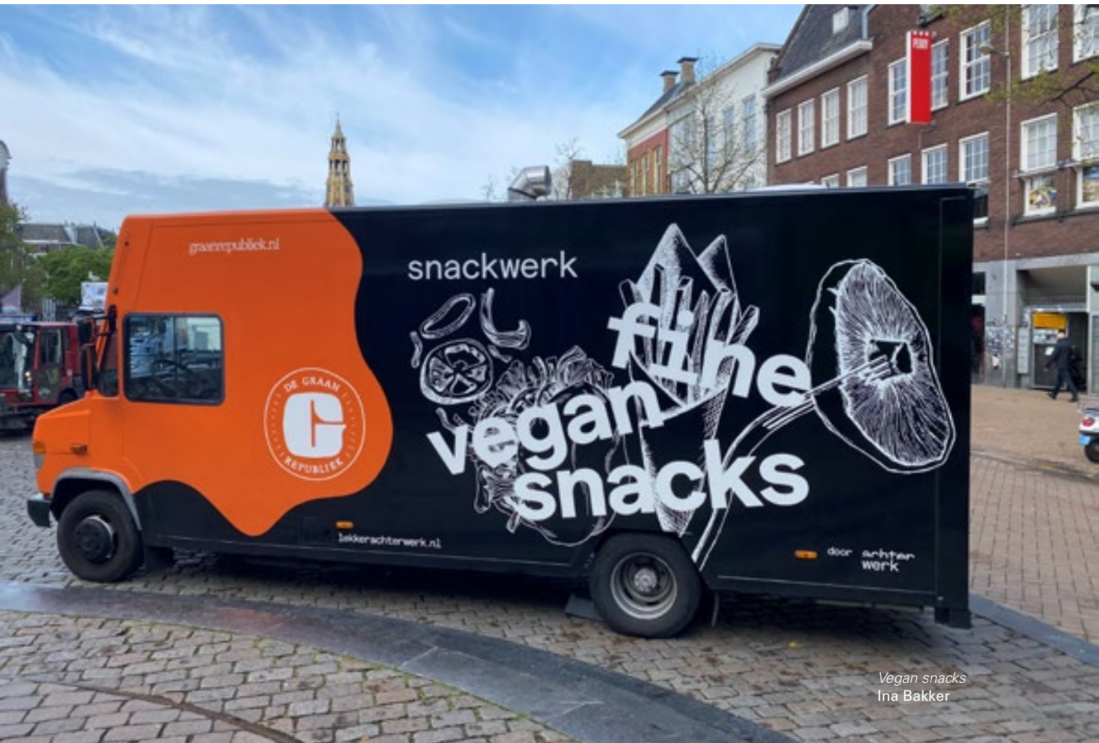
Vegan snacks Ina Bakker