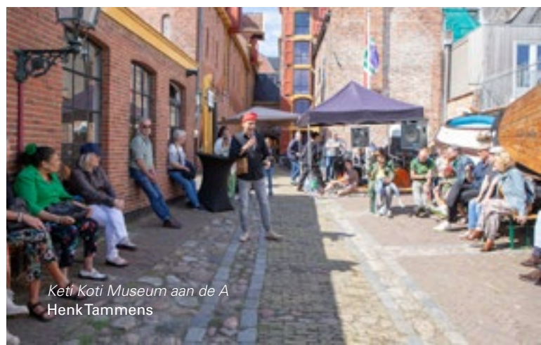
Ketj Koti Museum aan de A HenkTammens