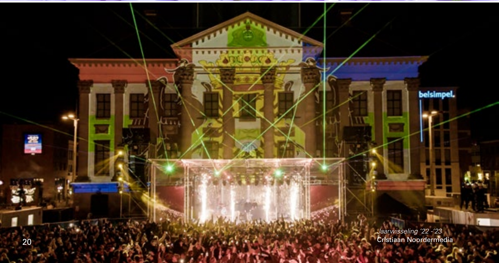
Jaarwisseling '22-'23 Cristiaan Noordermedia