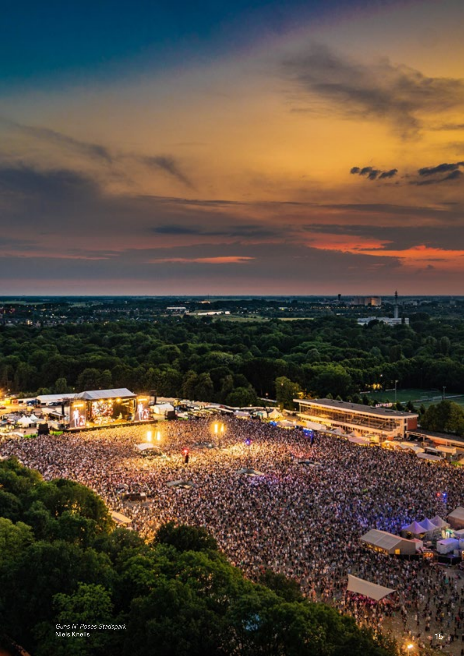
Guns N' Roses Stadspark Niels Knelis