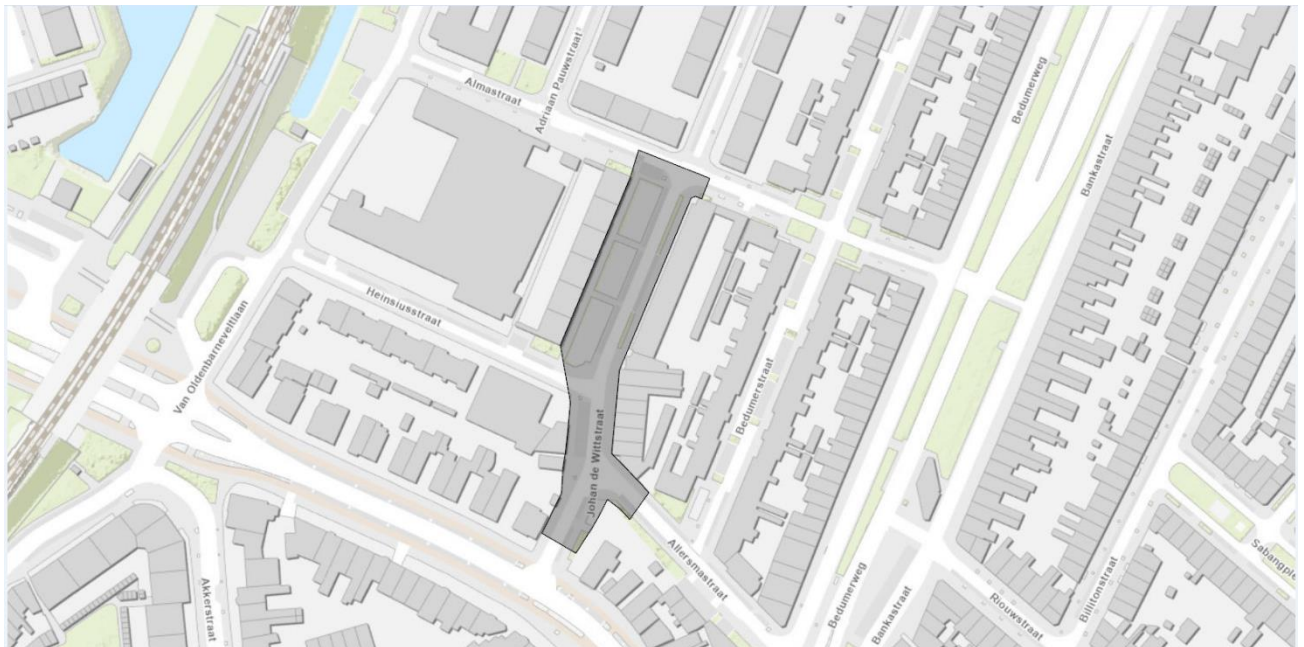
Figuur 1: ligging plangebied in de wijk

In 2021 diende één van de aanwonenden bij de wijkvernieuwing een projectplan in voor uitbreiding van pluktuin de Witte Velden. Ze maakte hiervoor een voorlopig ontwerp, maar schreef ook een duidelijke onderbouwing voor haar plan. Ze schreef over haar plan om de buurt mooier en groener te maken, en te zorgen voor meer biodiversiteit. Ze schreef daarnaast over het verhogen van de verkeersveiligheid, het tegengaan van parkeeroverlast in de straat, het aanleggen van een grasveld of bloemenweide, en meer ruimte te geven aan de natuur en daarmee hittestress tegen te gaan en de afvoer van hemelwater te verbeteren.