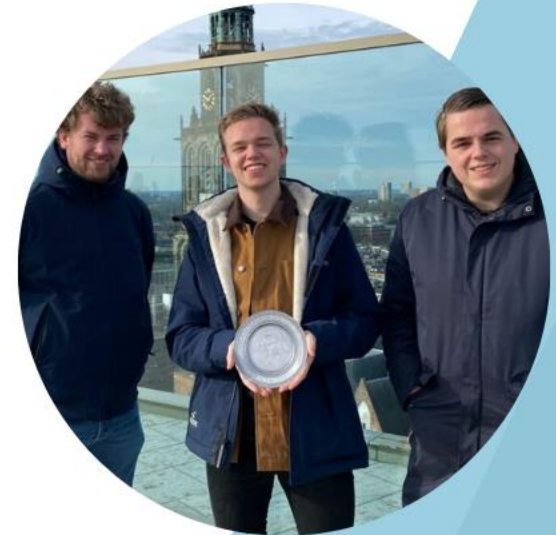
OOG voor Elkaar