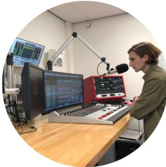
OOG voor Talent