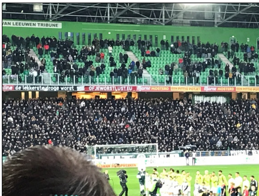
Een relatief lege 2 e ring en een overcrowded situatie op de 1 e ring met volle trappen Geen steward inzet zichtbaar.

Ook hoort daar, na realisatie, aanpassing van de steward- en beveiligingsinzet bij.