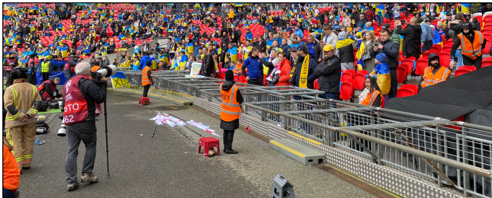
Maatregelen tegen veld betreden in Wembley Stadium