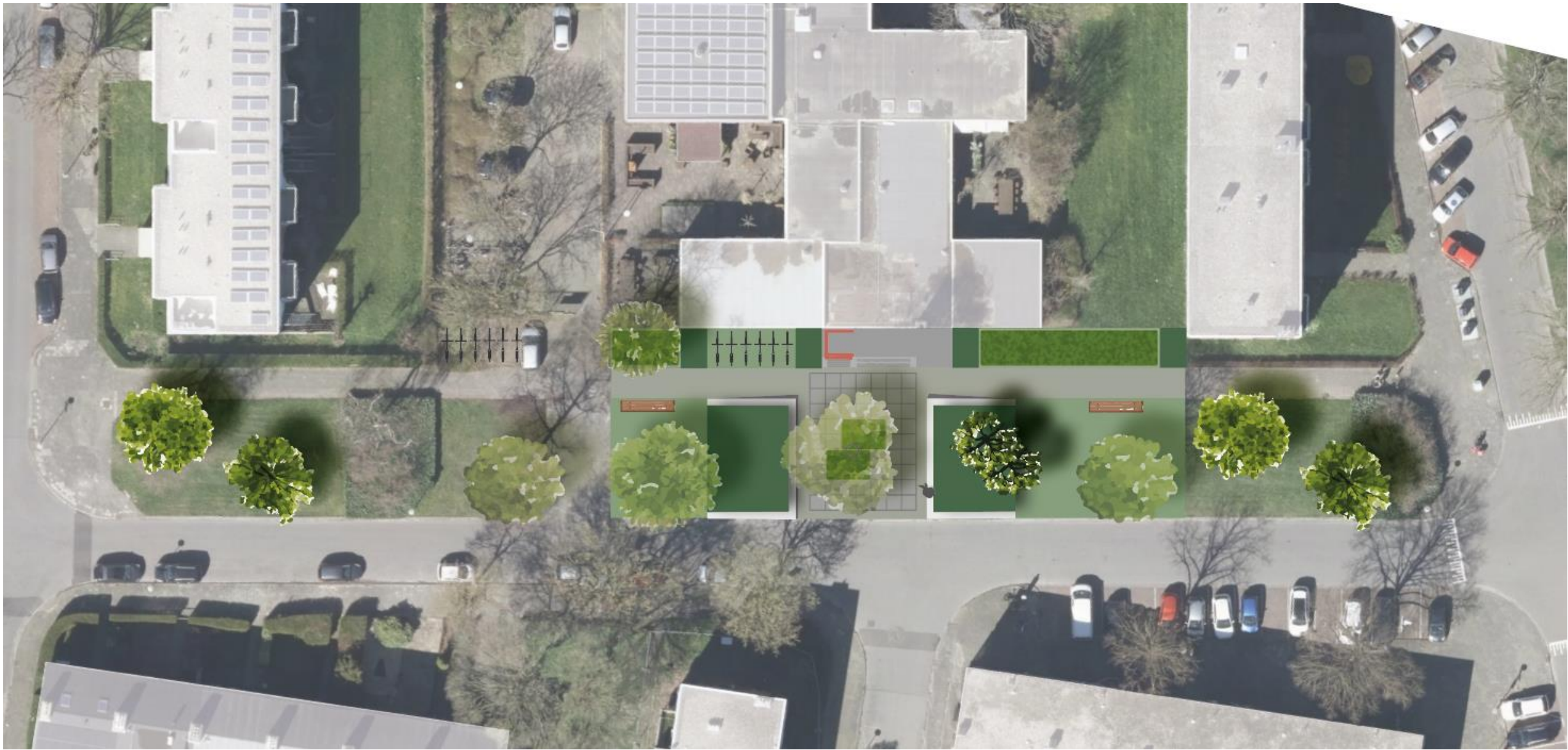
Schetsontwerp entreegebied Multifunctioneel centrum De Wijert / Helpman