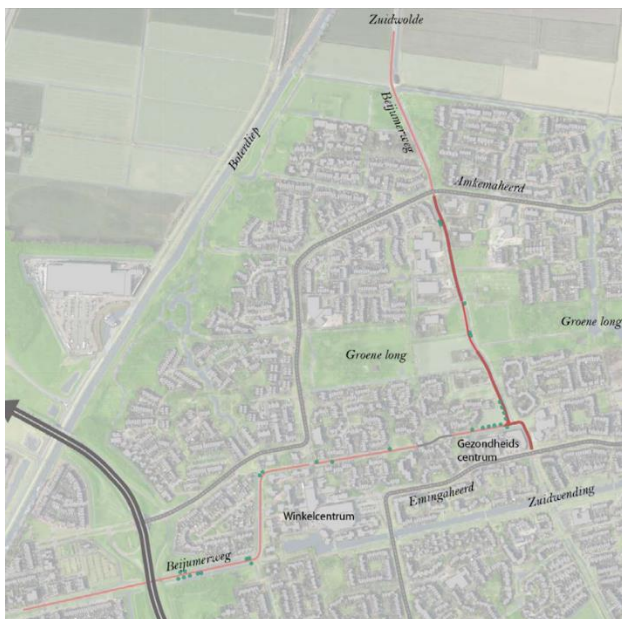
Afbeelding 1 Plangebied Beijumerweg

Op basis van genoemde uitgangspunten is de afgelopen periode gewerkt aan een voorlopig ontwerp. Hierbij is gekozen voor een eenduidige inrichting van de Beijumerweg met een duidelijke kantstrook. Het profiel sluit daarmee zo goed als mogelijk aan bij het profiel van de Beijumerweg tussen de Amkemaheerd en Zuidwolde. De verharde rijbaan wordt circa 4.00 meter breed (dit is nu 2.60 meter). Hierdoor kunnen auto's, fietsers en wandelaars gebruik maken van de Beijumerweg en elkaar op een veilige manier passeren. De 4.00 meter brede rijbaan is smaller dan de minimum wegbreedte voor een fietsstraat (4.50 meter). Een bredere rijbaan is niet mogelijk vanwege het historische karakter van de Beijumerweg en de beperkte breedte tussen de watergangen. Desondanks levert deze wegbreedte een aanzienlijke verbetering op voor zowel fietscomfort als de verkeersveiligheid.