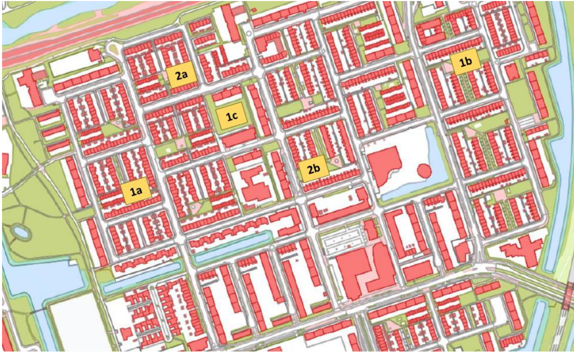
Overzicht locatie eerste vier binnentuinen en Sparrenveld (1c)