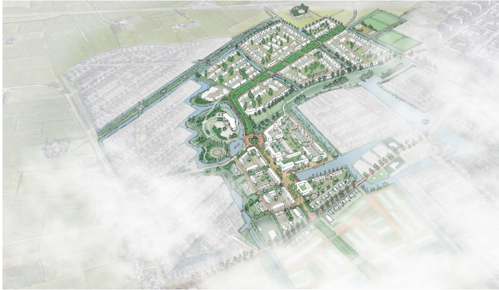
Vogelvluchtimpresie van het beoogde plan ten noorden van de Leegeweg

Op de wierden ontstaan buurten met als kenmerkend onderdeel van de wierde dat nagenoeg alle woningen een adres aan het groen krijgen. Ze grenzen of aan de groene omliggende structuren of aan een binnenparkje.